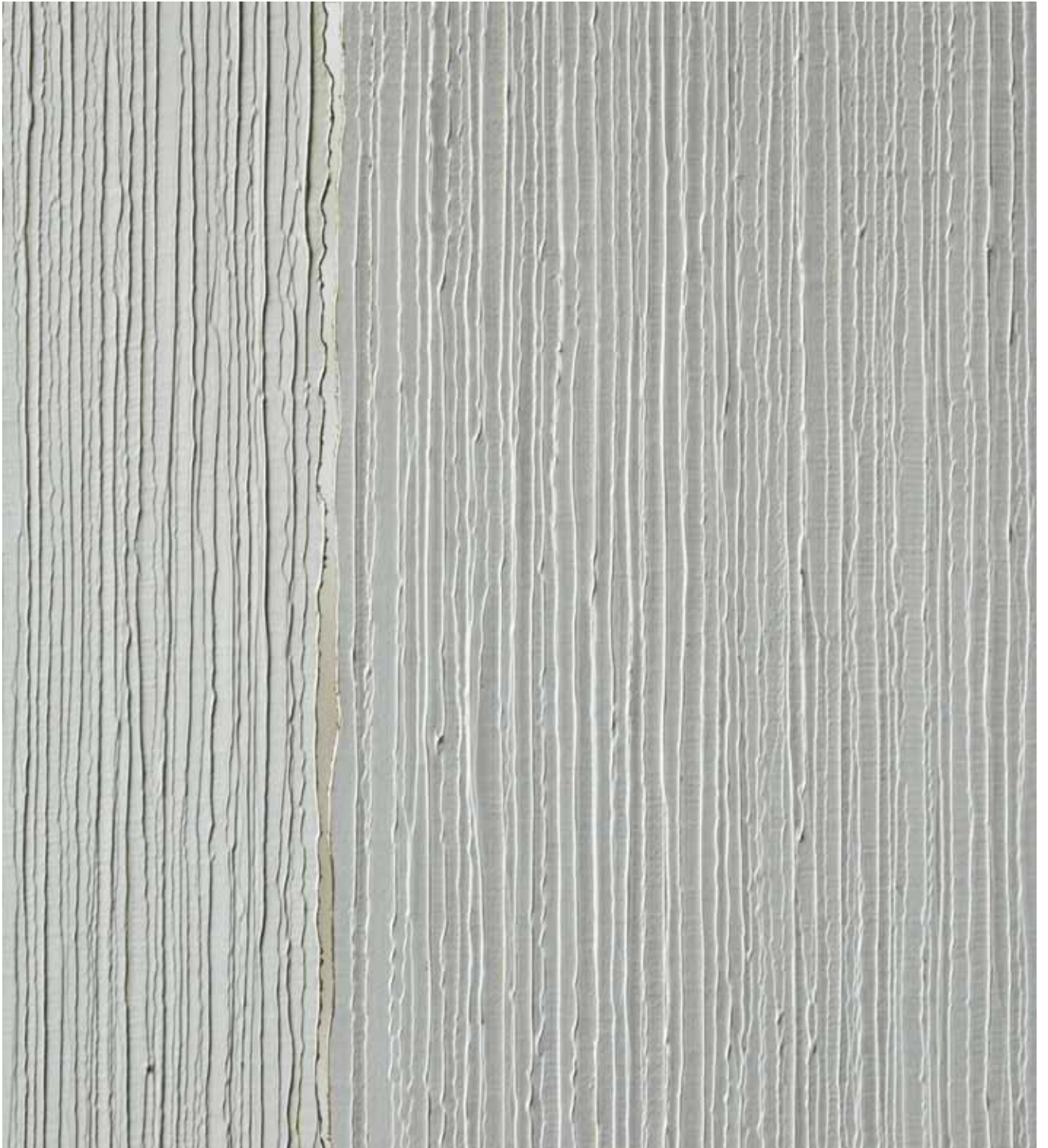
els moes obrazy a práce na papíře paintings and paperworks